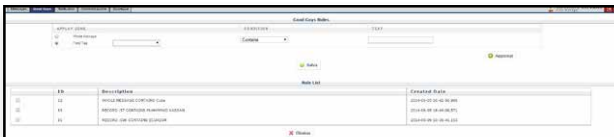
Interfaccia di gestione Good Guys